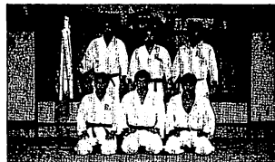
昭和60年度 大阪府総合体育大会 総合優勝

に分かれており、年齢や実力に合ったものを遊ぶことができます。対外的には、市の代表として出場する北河内総合体育大会や大阪府総合体育大会で、毎年、好成績を収めています。