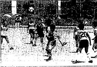
少年サッカー一枚方パーク杯の熱戦

はじめに ワールドカップ86メキシコ大会は、全世界の人々を興奮させた。サッカー連盟は、そういった27チームで結成されている。職域単位のチームもあればクラブチームもあり多様である。サッカーマンのメッカといふ場所的な本拠地が今後の発展にぜひ必要なので、40万市民を擁する本市での専用グラウンドの確保が望まれている。