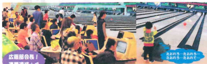
広報部会長！連覇達成☆