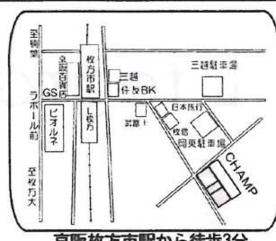
京阪枚方市駅から徒歩3分